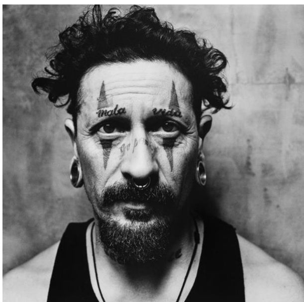
Adenoi, 2019